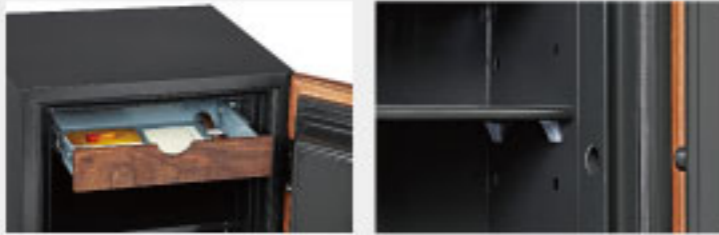
· 桃木紋滑動式抽屜