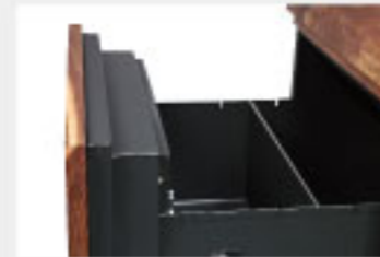
· 下層設有文件分類隔板