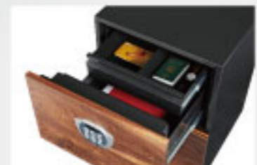
· 上層設有隱藏小抽屜