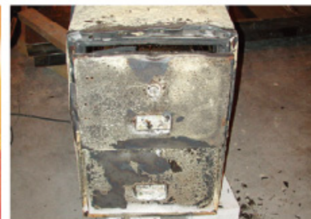
3. 保險箱防火測試之後