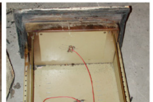
4. 防火測試後的機身內部