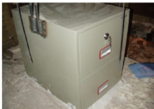
1. 保險箱防火測試前

通過瑞典SP(Diskette, CD)檢驗標準1,010℃高溫燃燒1至2小時，櫃內溫度不超過45℃，適合存放隨身碟，光碟及怕高溫物品。